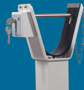
Profil-Zylinderschloss am Auflagepfosten (optional)