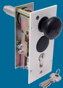
Verriegelung 1 und 2* Profil-Zylinderschloss am Schrankenstander (optional)