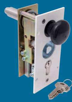
Verriegelung 3 und 4* Feuerwehr-Dreikant und Profil-Zylinderschloss am Schrankenstander (optional)