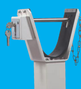
Profil-Zylinderschloss am Auflagepfosten (optional)