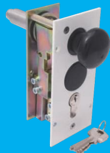
Verriegelung 1 und 2* Profil-Zylinderschloss am Schrankenständer (optional)