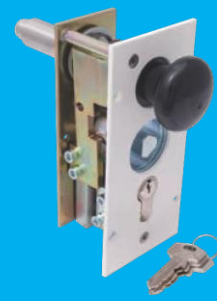
Verriegelung 3 und 4* Feuerwehr-Dreikant und Profil-Zylinderschloss am Schrankenständer (optional)