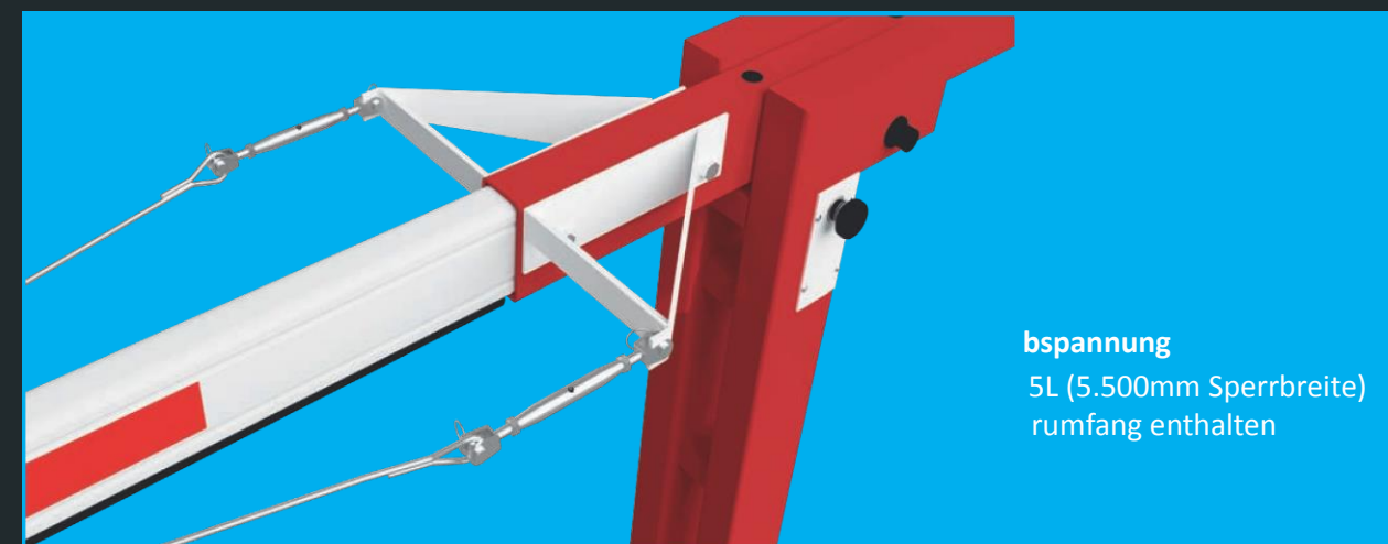
abspannung 5L (5.500mm Sperrbreite) umfang enthalten

Ihr Partner für Vertrieb - Montage - Service: