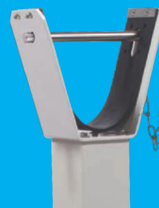
Edelstahlbolzen für bauseitiges Vorhänge- schloss am Auflage- pfosten (optional)