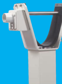
Feuerwehr-Dreikant am Auflagepfosten (optional)