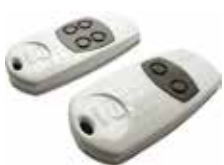
TOP-862EV • TOP-864EV

Mit dem "Key Code" wird ein Passwort-Code verwendet, um die Programmierung des Handsenders vorzunehmen. Dies ermöglicht die Kontrolle der Selbstlernfunktion des Codes von Handsender zu Handsender und vermeidet die unkontrollierte Duplizierung der Geräte. Twin bietet 4294967896 Kombinationen und ist mit 2 oder 4 Kanälen verfügbar, zudem bietet der Handsender Raum für einen TAG-Glastransponder. Dies erweitert im Fall der Kombination mit Zugangskontrollsystemen von Came die Funktionalität.