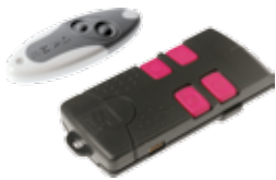
TAM-432SA • T438

Das Selbstlernen des Funkcodes von Handsender zu Handsender vervollständigt die fortschrittlichen Eigenschaften dieses Geräts.